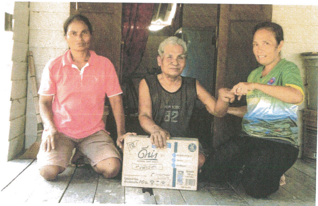
ภาพการลงเยี่ยมผู้สูงอายุที่มีภาวะพึ่งพิง