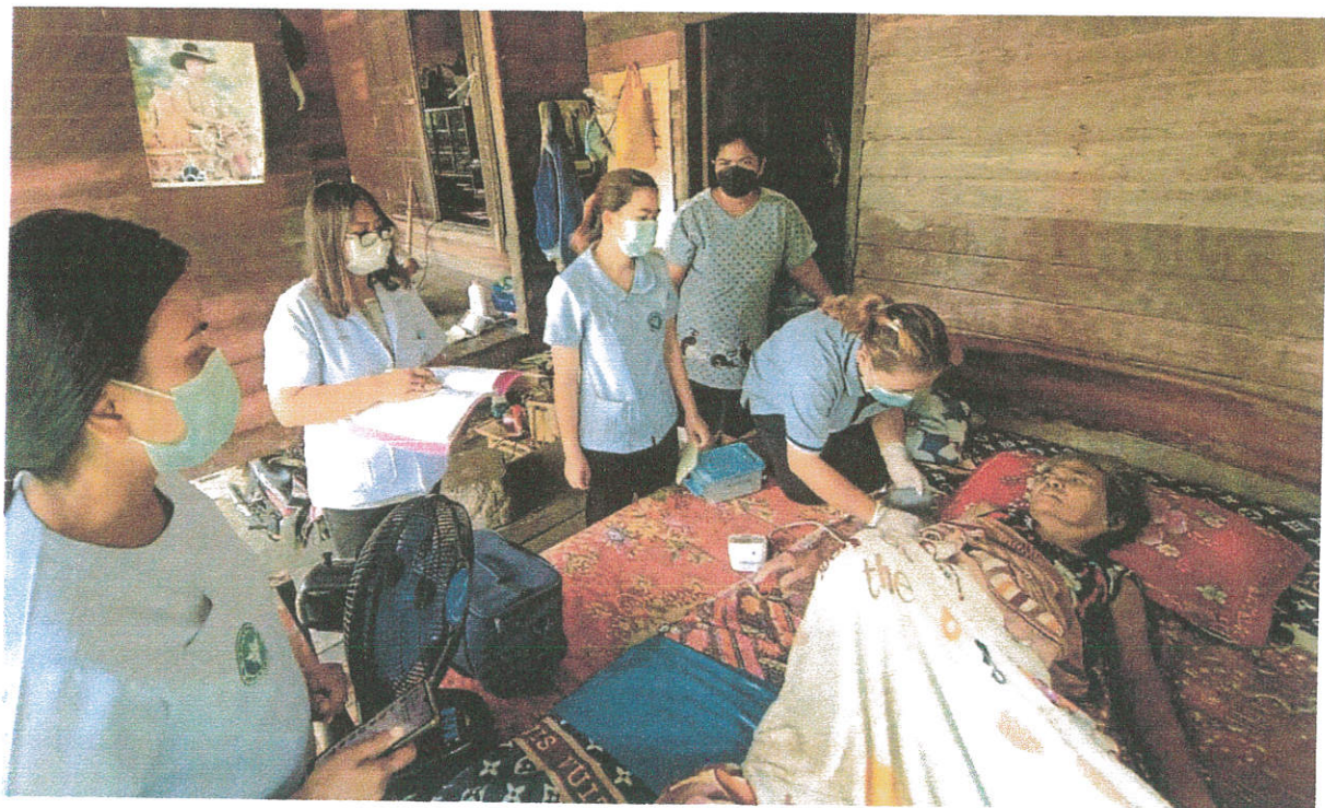
ภาพการลงเยี่ยมผู้สูงอายุที่มีภาวะพึ่งพิง