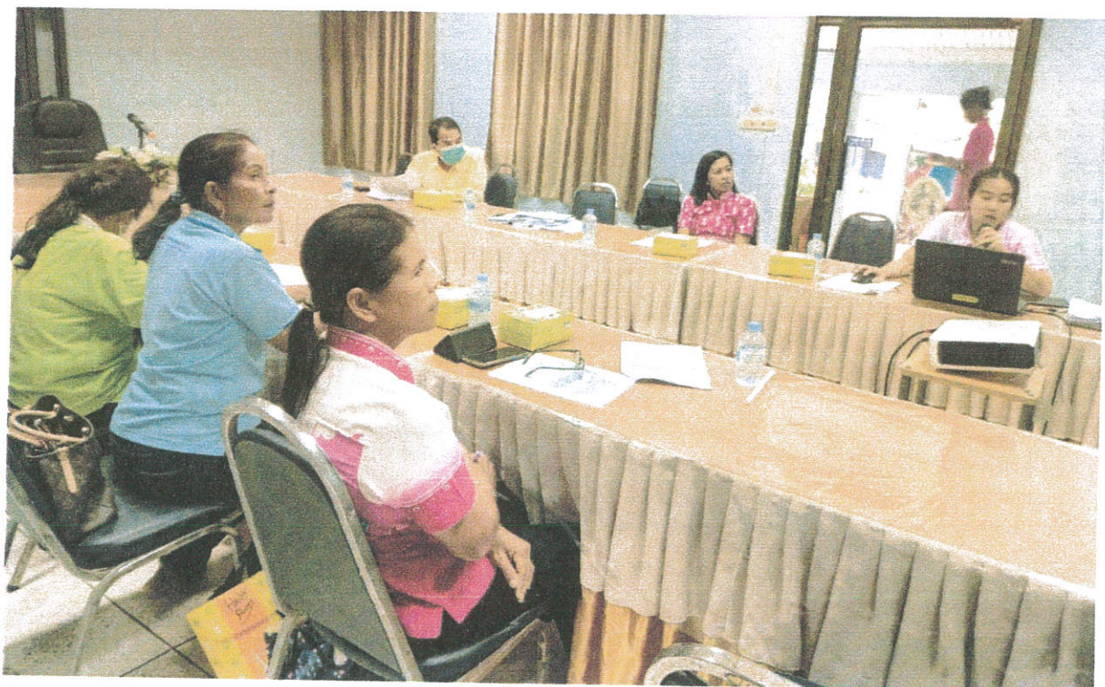
ภาพการประชุม