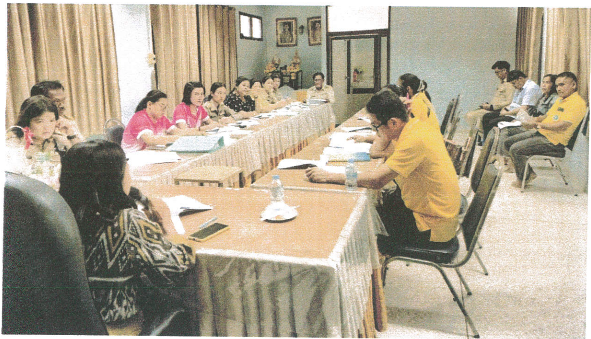
ภาพการประชุม