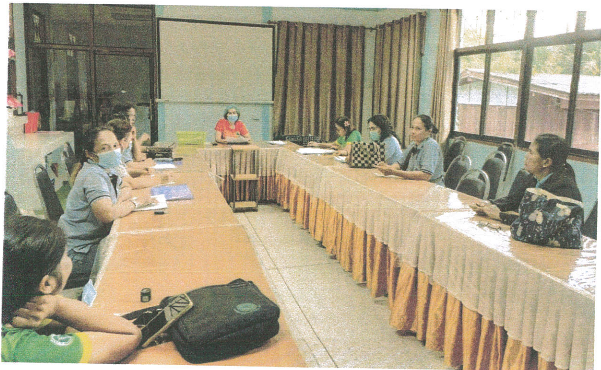
ภาพการประชุม